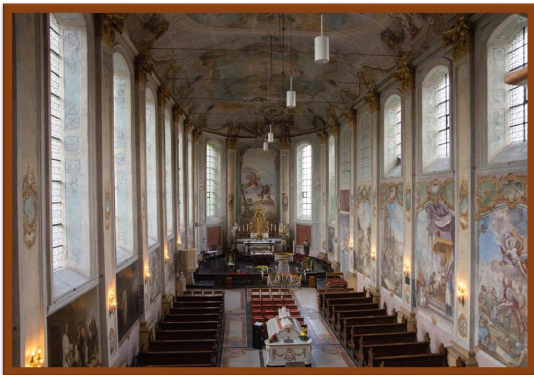
Interieur van de Gerlachuskerk met links een deur voor de pelgrims. In het midden het graf van St. Gerlach. De schilderijen van Schöpf van het leven van St. Gerlach zijn aan de rechterzijde te zien. Rechts zijn ook de twee ingangen vanuit het klooster.

Als u meer wilt weten over het Norbertinessenstift, dan kunt u daarvoor de website van de Vrienden van St. Gerlach bezoeken ( www.vriendenvansintgerlach.nl ). In de parochiekerk in St. Gerlach, de voormalige kloosterkerk, kunt u de fresco's over het leven van St. Gerlach zien en ook de wapens van kanunnikessen en van de proost en priorin die in de 18e eeuw deze fraaie kerk hebben laten bouwen.