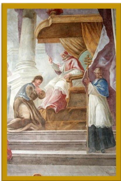
St. Gerlach bij paus Eugenius III

In de bij de Vita horende tekst van de Miracula staan vele wonderen van St. Gerlach beschreven, zoals het wonder van het water dat voor hem geput werd dat in wijn veranderde. Dat was een teken van heiligheid, maar ook van een naderend einde. Niet veel later overleed St. Gerlach bij zijn kluizenarij, waar hij op eenvoudige wijze begraven werd in een houten kist. Omdat aan zijn kluizenarij geen priester verbonden was, was er niemand om hem te bedienen met het laatste sacrament. Zijn laatste communie en ziekenzalving werden hem echter op wonderbaarlijke wijze toegediend door de heilige die hij als kluizenaar zo vereerd had, St. Servaas. Zijn botten (reliken) zijn bewaard gebleven en bevinden zich in een schrijn (kist) bij zijn praalgraf. Splinters daarvan zijn geschonken aan kerken elders waar St. Gerlach vereerd wordt. Zijn schedel, tenslotte, is verwerkt in een reliekbuste die in de schatkamer van het heiligdom van St. Gerlach in Houthem te zien is. Recent onderzoek van zijn botten maakt op basis van leeftijd en lengte aannemelijk dat het inderdaad St Gerlach is, die in het reliekschrijn in Houthem bewaard wordt.