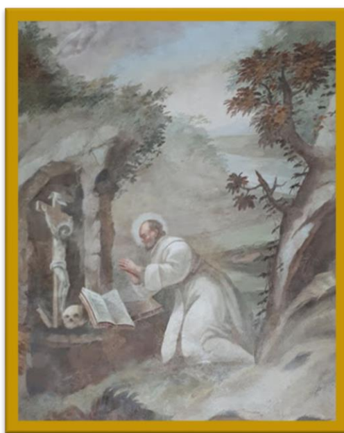
St. Gerlach als kluizenaar