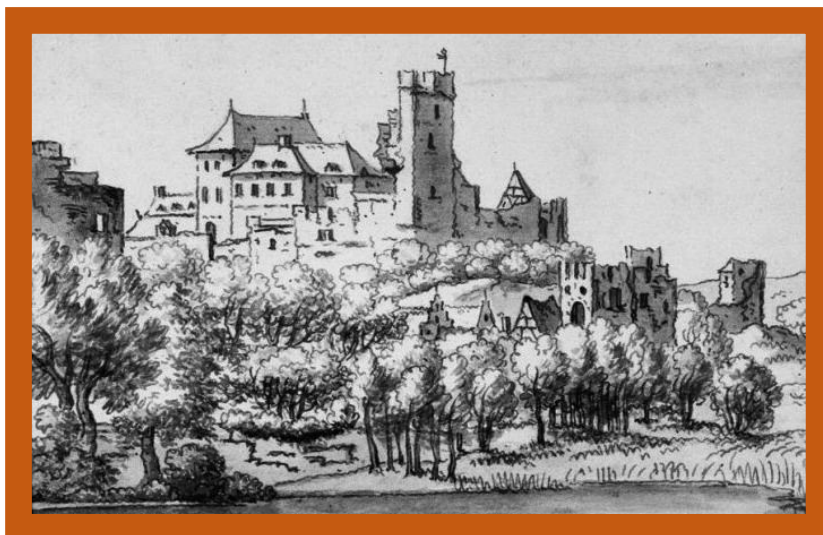
Het kasteel van de heren van Valkenburg