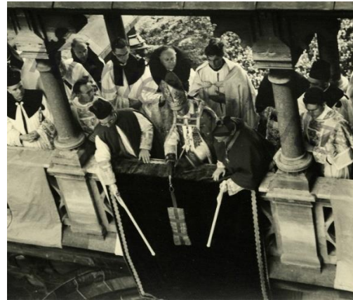
Toning van de doeken vanaf de galerijen van de Dom van Aken