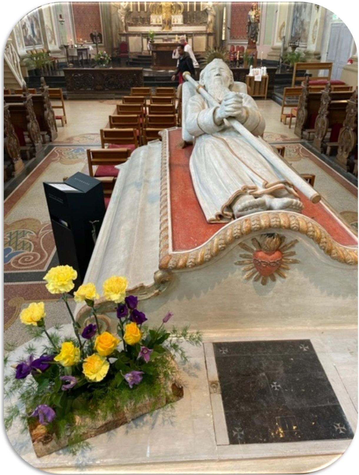
St. Gerlach voorafgaand aan de Paaswake in Houthem met een bloemstuk met voorjaarskleuren