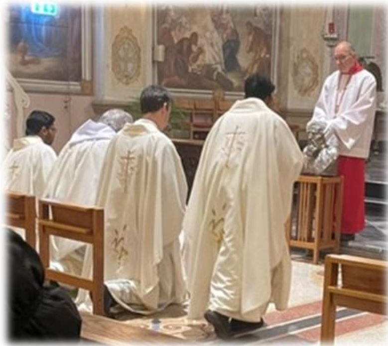
Verering van en gebed tot St. Gerlach door de vier celebranten