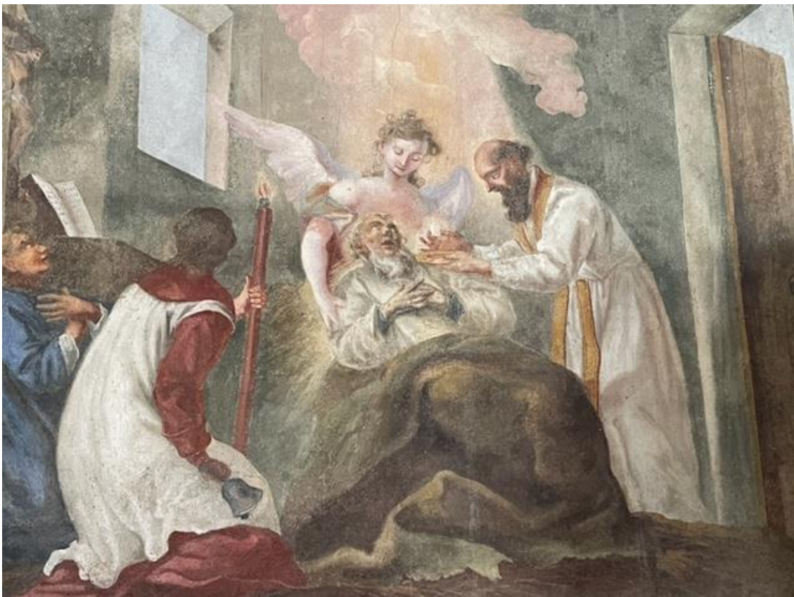
Boven: het sterfbed van St. Gerlach met rechts St. Servaas met de laatste H. Communie in zijn handen

En zie, een eerbiedwaardige grijsaard in een sneeuw wit kled, voorafgegaan door een jonge man, trad ten aanschouwe van allen binnen in het vertrek waar de man Gods in doodstrijd verkeerde. Hij groette allen en naderde tot bij de zalige Gerlach die aan het einde van zijn kommervolle leven gekomen was. Hij sprak tot hem woorden van troost als tot een vriend die naar zijn vaderland terugkeert, sterkte hem met het heilzame viaticum en met alle genademiddelen die men pleegt te geven aan gelovigen die op het punt staan dit leven te verlaten.