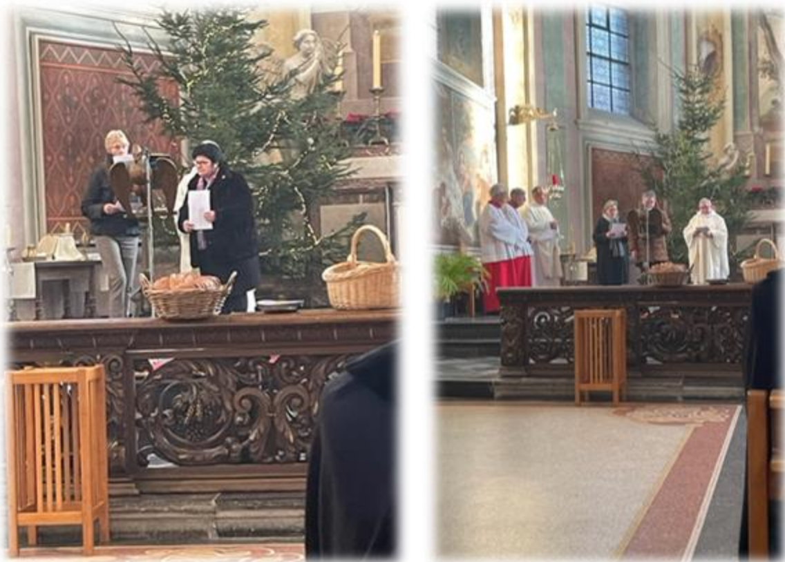
Hierboven: vertegenwoordigsters van Zij Actief aan het woord, waaronder een van de leden van de klankbordgroep van Vrienden van St. Gerlach.