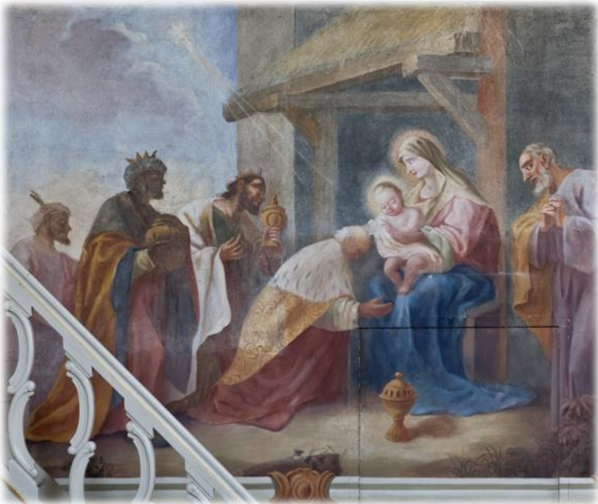
Boven: het driekoningen fresco met aanbieding van de geschenken in de St. Gerlachuskerk in Houthem. Beeldbank RCE doc.nr. 539.223. Fotograaf Paul van Galen

Na afloop van de H. Mis was het aan het klaroenkorps van de schutterij St. Martinus om zich de longen uit het lijf te blazen, terwijl pater Van Meijgaarden het Gerlachusbrood zegende en aan de kerkgangers uitdeelde.