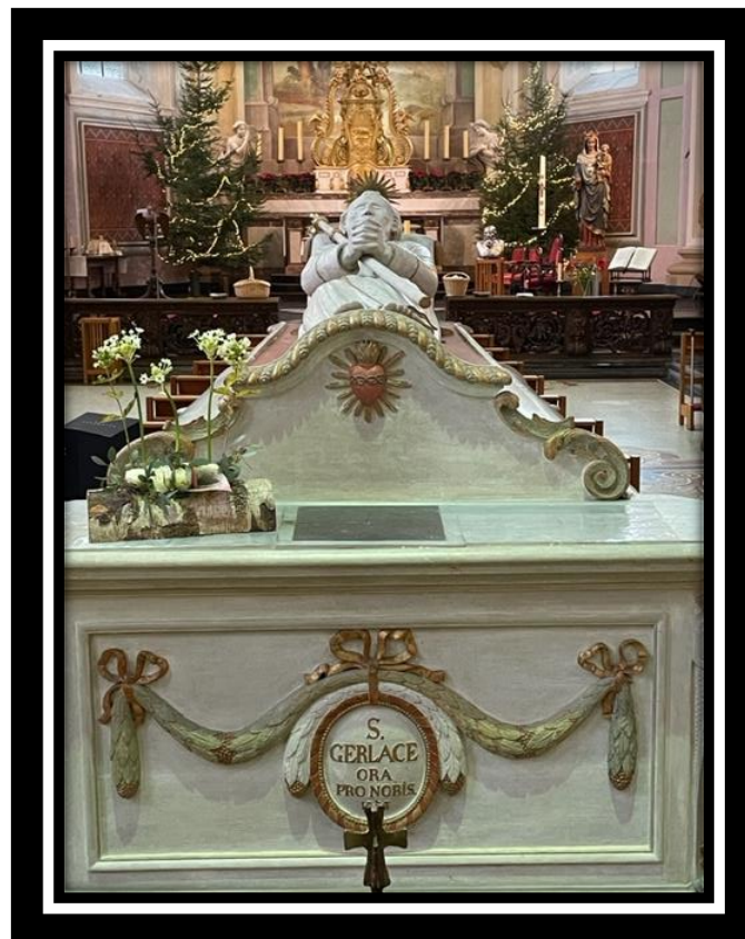
5 januari 2024 - de 859 ste sterfdag van St. Gerlach