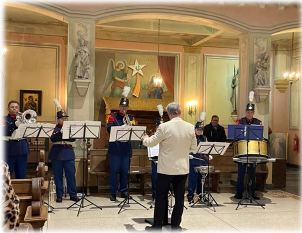
De H. Mis van 9.30 uur werd muzikaal werd opgeluisterd door de drumband van schutterij Sint Martinus en het dameskoor Cantate uit Sittard. Schutterij Sint Martinus zorgde vookeer een erwacht op het priesterkoor. Foto's: erwacht (beneden) en klaroencorps (boven) van Schutterij St. Martinus van Houthem-St. Gerlach tijdens het octaaf in de H. Mis op 7 januari 2024