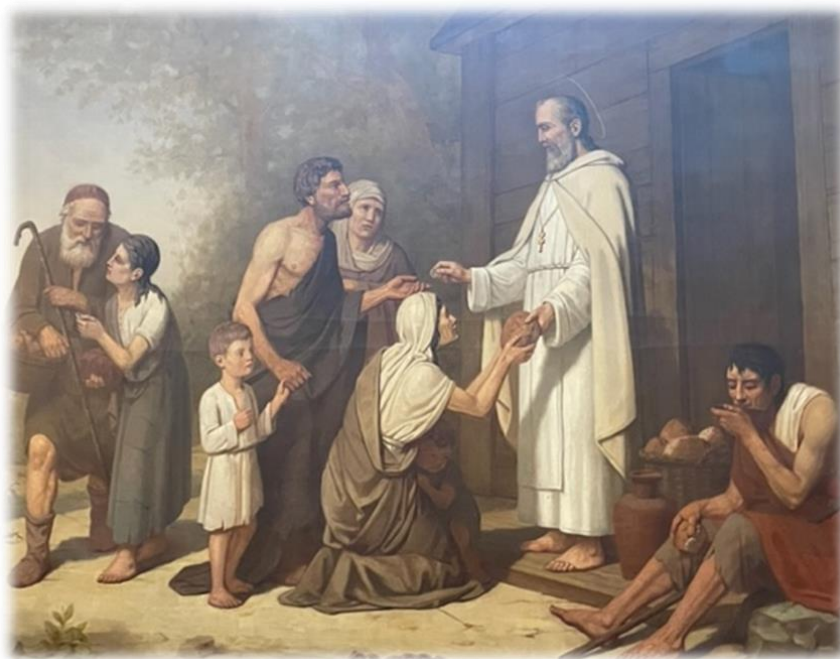
St. Gerlach voor zijn houten kapel deelt Gerlachusbrood uit aan mensen uit de omgeving Houthem

In de middag werd de eerste dag van het Octaaf, de feestdag van St. Gerlach, afgesloten met de aankomst van de pelgrims die in Houthem hun traditionele Gerlachus wandeling vanuit de Gerlachusparochie in Banholt naar het graf van St. Gerlach voltooiden.