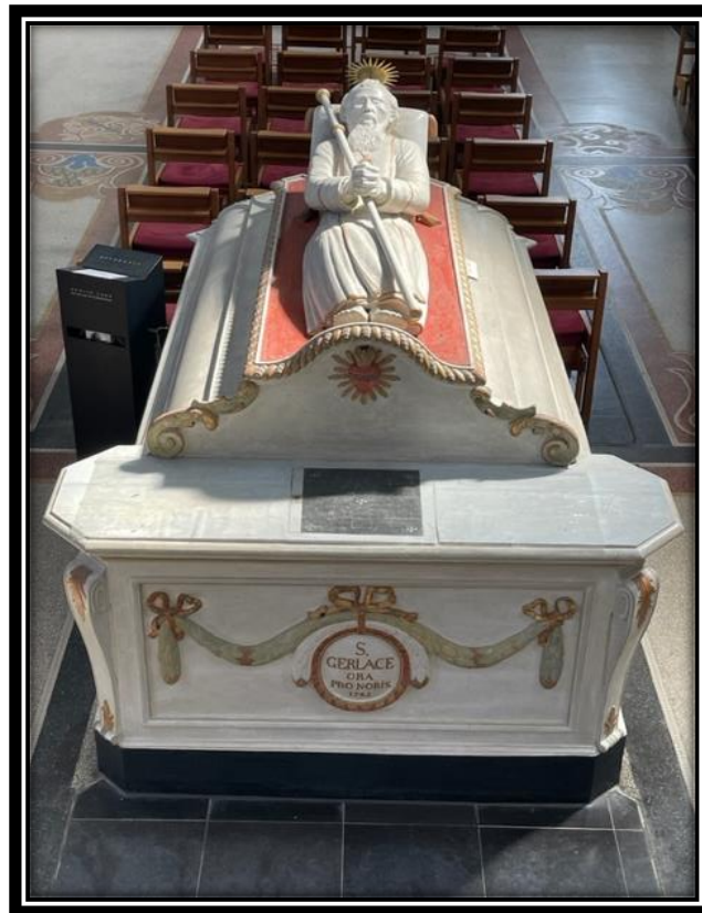
Grafmonument van St. Gerlach te Houthem