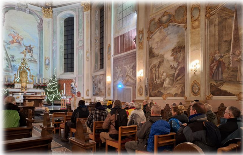
Links: H. Mis in de vroege ochtend voor de deelnemers aan de voettocht naar Banholt

Om 7.15 uur zondagmorgen 5 januari verzamelden zich een 35-tal pelgrims in de kerk in Houthem om een voettocht naar Banholt te ondernemen met de gezichtsreconstructie en een relikwie van St. Gerlach op een draagberrie. Vanwege het 150-jarig bestaan van de kerk van Banholt was tot deze pelgrimstocht besloten. Na een kort openingsgebed en de zegen van pastoor Dieteren werd, in de stromende regen, vertrokken om tijdig voor de hoogmis van 11.00 uur weer in Banholt te zijn.