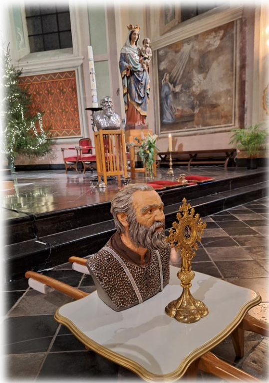
Een weerbestendig verpakt relik van St. Gerlach en de gezichtsreconstructie van St. Gerlach begeleiden de pelgrims op hun tocht.