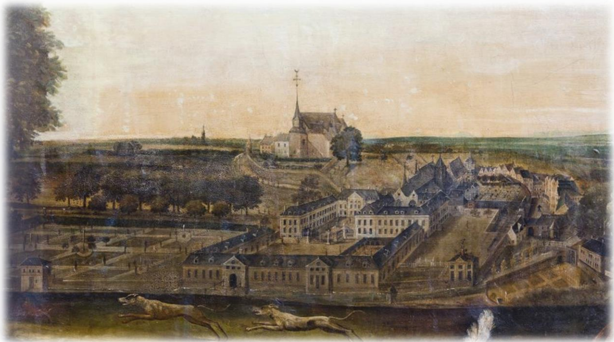
Boven: jachtscene (schilderij 18 e eeuw) met op de achtergrond de rijksabdij en op de heuvel de Stefanuskerk.

Terug op de Markt in Kornelimünster was het even zoeken naar een café voor een kop koffie omdat vrijwel al de oude horecapanden op de Markt nog niet hersteld zijn van de watersnood. Gelukkig was wel het "Café Paris" open, waar we gastvrij werden ontvangen. Na een kop koffie, besloten we de dag van de Religieuzen waardig af te sluiten met een kort bezoek aan de moderne Benedictijner abdij van Kornelimünster, die in 1906 vanuit Merkelbeek is gesticht (en daarmee een "zusje" is van de abdij Benedictusberg in Mamelis bij Vaals). Ook hier troffen we het en was de kloosterkerk die dag geopend. Het is op het eerste gezicht, mede vanwege de grote afmetingen, een wat kil aandoende kloosterkerk. Maar de vier schilderijen in de kerk van de textielreliëken van Kornelimünster (enkele doeken van de