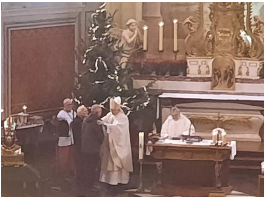
Links: uitreiking van versierselen Orde van H. Gerlachus aan vrijwilligers na afloop van de eucharistieviering.