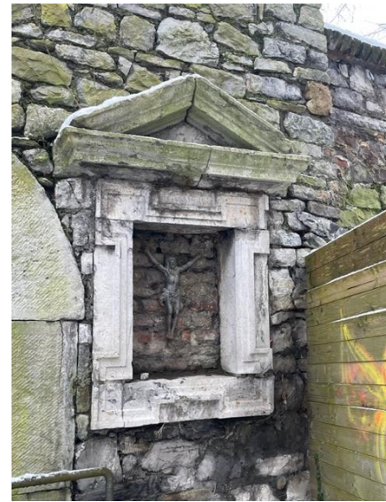
Links: de galerijtoren, de oude abdijkerk en het Benedictijnerklooster vanaf de beklimming. Rechts: een oud kruis met modern corpus bij de ingang naar de Stefanuskerk.