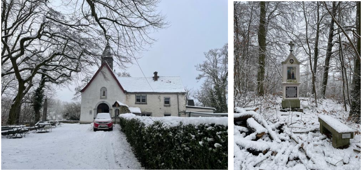
Links: de kluizenarij vanaf de weg. Rechts: een voetval met bankje in het sneeuwlandschap tijdens het Octaaf.

De bewoner van de kluizenarij had zijn auto voor de kapel geparkeerd, waardoor de foto hieronder van de kluizenarij Maria im Schnee wat minder idyllisch werd dan anders het geval geweest zou zijn: