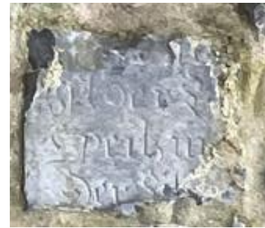
Links: de Middeleeuwse toegangspoort die vanuit het noorden door het dal van de Inde toegang tot de rijksabdij Kornelimünster gaf. Rechts: de resten van 17 e -eeuwse grafstenen (?) in de muur.