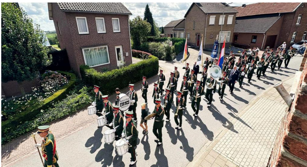
Drumband harmonie Amicitia Banholt

Ook voor de Heiligdomsvaart dit jaar zijn weer plannen gemaakt om mee te trekken. Tijdens de voorbereiding bleek dat ook in onze zusterparochie in Banholt animo bestond, in het kader van het 150-jarig bestaan van de parochiekerk, om mee te gaan. Samen zal dat leiden tot een mooie groep die Sint Gerlach begeleiden zal in Maastricht. Zo fungeert Gerlach als bruggenbouwer tussen de twee parochies, conform het thema van deze Heiligdomsvaart: "Wees een bruggenbouwer". Vanuit Houthem zal het borstbeeld met een dragersgroep en een regionaal samen te stellen gelegenheidskoor naar Maastricht gaan. Vrienden van Sint Gerlach die daar belangstelling voor hebben zijn uitgenodigd zich hierbij aan te sluiten. De gezangen zijn eenstemmige, vaak bekende, liederen, waarvan u de tekst tijdig aangereikt krijgt. U kunt zich aanmelden via info@vriendenvansintgerlach.nl of bij een van de bestuursleden. Vanuit Banholt zal de harmonie met de drumband meegaan, alsmede het bestuur van de jonkheid met een Gerlachusbeeld en een groep met afbeeldingen uit het leven van Gerlachus.