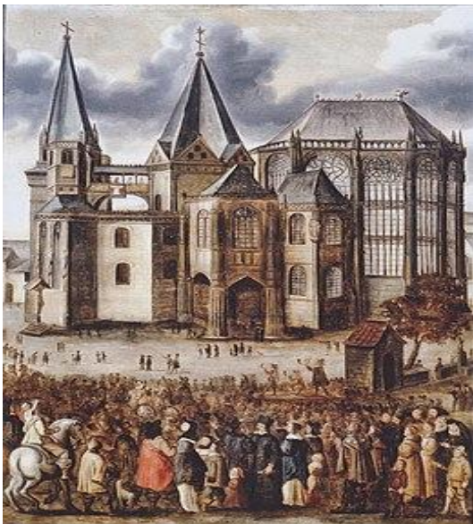
Heiligdomsvaart in Aken, 1622. Het kleed van Maria wordt getoond vanaf de galerij tussen de torens.

Het is niet bekend waar en wanneer het fenomeen van de heiligdomsvaart is ontstaan. Aangenomen mag worden dat de toning van relieken samenhangt met de aan de relieken van een bepaalde heilige toegeschreven macht om te genezen, of rampen af te wenden. De oudste vermeldingen van zulke evenementen stammen uit de middeleeuwen. Met het deelnemen aan een heiligdomsvaart en het zien of aanraken van relieken, konden in de late middeleeuwen aflaten worden verdiend, waarmee gelovigen hoopten na hun overlijden eerder uit het vagevuur verlost te worden en in de hemel te komen. De toestroom van duizenden (in sommige gevallen tienduizenden) pelgrims tijdens een heiligdomsvaart vormde intussen een belangrijke bron van inkomsten voor de organiserende kerk en een impuls voor de lokale economie.