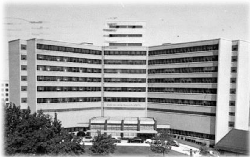
Onder: Grace New Haven Community Hospital (1945)