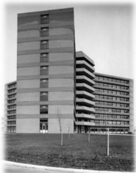
Links: Vijverdal (1972-2007).

In 1972 werd in Maastricht het psychiatrische ziekenhuis in hoogbouw, Vijverdal, door prinses Margriet geopend. Het was een flat, geïnspireerd door het Grace New Haven Community Hospital (New York). Het doel was niet om in Vijverdal psychiatrische patiënten op te bergen, zoals voorheen wel werd gedaan, maar om ze o.a. met psychofarmaca te genezen.